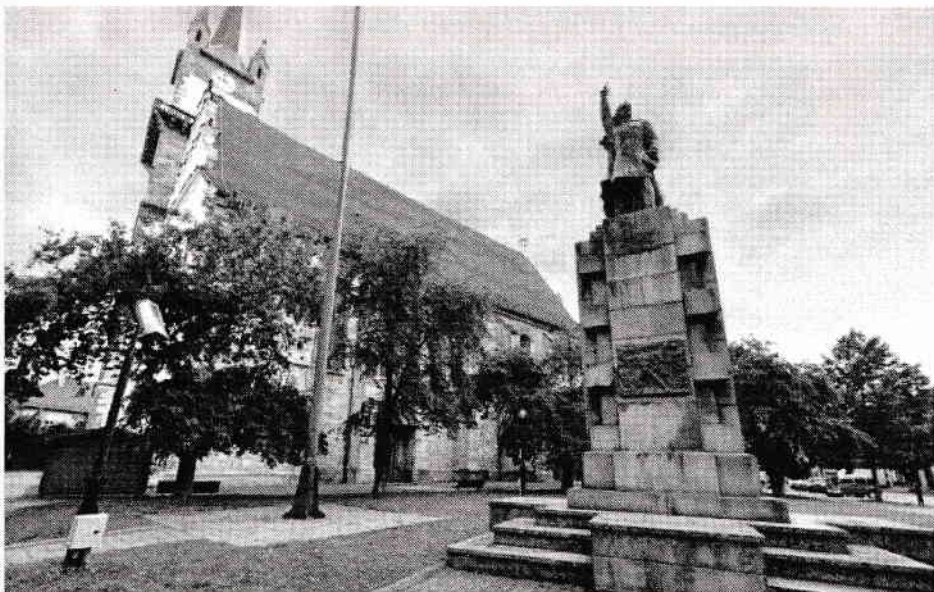
Piața Centrală din Bistrița, statuia poetului Andrei Mureșanu

La originea Imnului Național al României se află poemul patriotic „Un răsunet”, scris de Andrei Mureșanu și publicat pentru prima dată în numărul 25 din 21 iunie 1848 al suplimentului „Foaie pentru minte, inimă și literatură”, pe o melodie culeasă de Anton Pann.